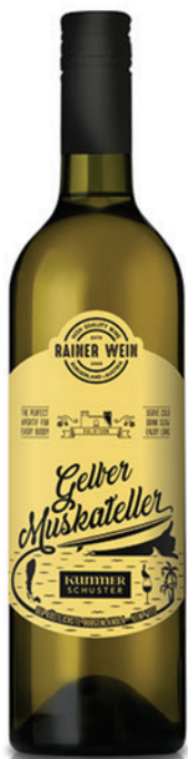
Rainer Gelber Muskateller

NEU im Programm aus der Rainer Wein Linie: der Rainer Rosé. Rosé ist mittlerweile bestimmend in die Weinwelt eingezogen und freut sich über immer mehr Zuspruch. Wurde er früher mit Leichtigkeit und Lebensgefühl in Verbindung gebracht, so zeigt er heute Komplexität und Frische in besonderer Art. Ein feiner Rosé aus der Sorte Zweigelt! Passt hervorragend zu Fisch, sommerlichen Salaten, zu Gegrilltem und ist beliebter Sommer- und Terrassenwein!