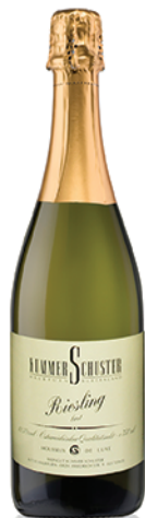
Riesling Sekt Brut Prickelnd & Trocken 0,75l Fl.